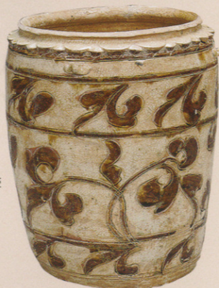
白釉褐彩花唐草文四耳壺 陳～黎朝(14～15世紀) 前期展示