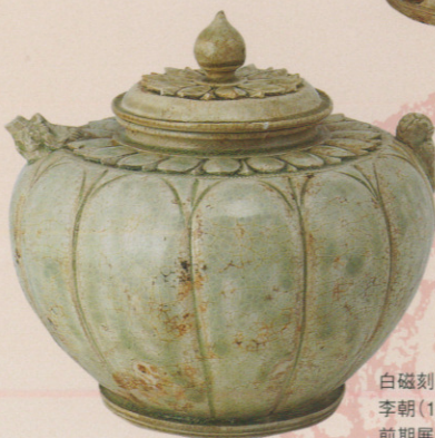
白磁刻花蓮弁文瓜形水注 李朝(11～12世紀) 前期展示