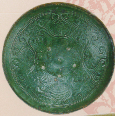
緑釉印花唐子文皿 李～陳朝(12～13世紀) 前期展示