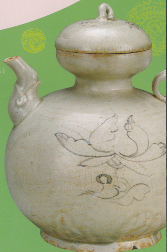
鉄絵蓮文甗形水注 陳朝(14世紀) 後期展示