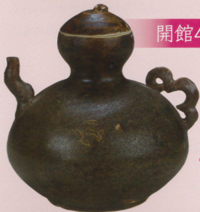
褐釉甗形水注 陳朝(14世紀) 前期展示