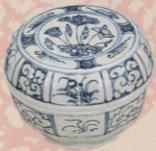
(左)青花蓮花文合子 黎朝(15世紀) (中)青花舟人山水文合子 黎朝(15世紀) (右)青花山水文合子 黎朝(15世紀) いずれも後期展示