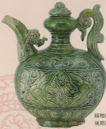
緑釉印花双鳳文水注 黎朝(15世紀) 後期展示