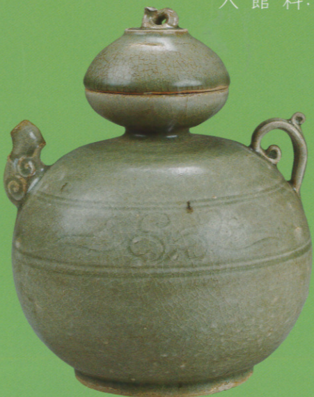
青磁刻花唐草文甗形水注 陳朝(14世紀) 前期展示