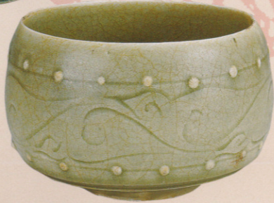
青磁刻花葉文播座碗 陳朝(14世紀) 後期展示